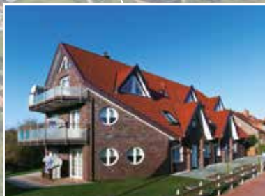
Winkelschiffchen I DÜNENSTR. 40