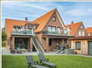
Winkelschiffchen IV DÜNENSTR. 32

www.winkelschiffchen.de info@winkelschiffchen.de