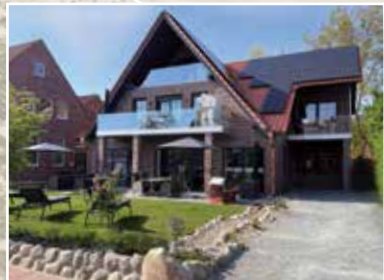
Winkelschiffchen V MITTELSTR. 4