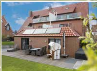
Winkelschiffchen II GARTENSTR. 21