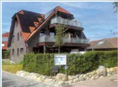
Winkelschiffchen III DEICHSTR. 18